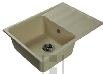
Harte 5068 бежевая