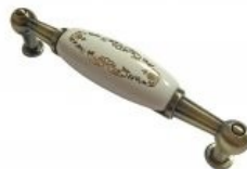
Скоба «Фарфор + золото», 96 мм.