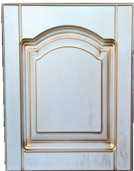
Фрезеровка «Глория» Пленка ПВХ – «Сосна белая» + золото