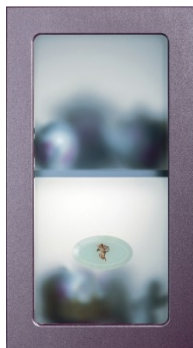
Стекло «Сатин светлый» с деколью «Ангел» НЕ ДОСТУПНО К ЗАКАЗУ изучение спроса