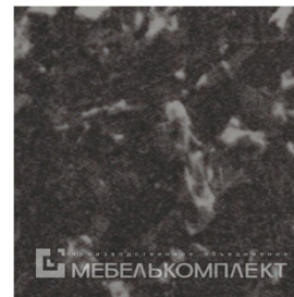
713 «Гранит черный»

Обращаем Ваше внимание на то, что пленка «Сосна белая» имеет не однородную, мало заметную текстуру, по этому возможно, что на одном фасаде текстура проявится активно, а на другом текстура будет еле заметна.